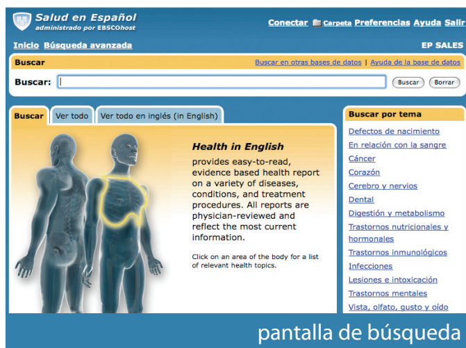
pantalla de búsqueda