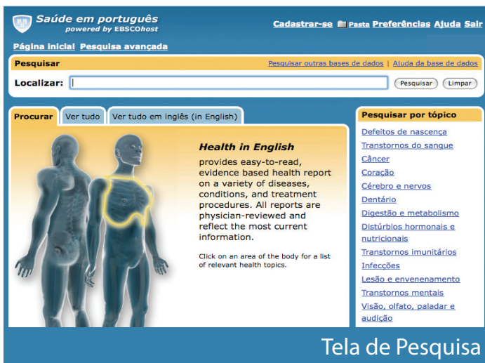
Tela de Pesquisa